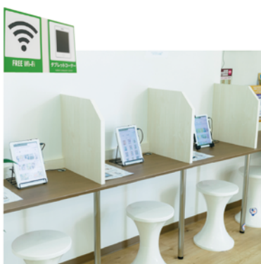
タブレットコーナー

混雑時の待ち時間に、待合室に設置したタブレットを使って雑誌を読んでもいただけます。一度使用されたタブレットは、表面消毒を行っていますので、安心してご利用いただけます。FREE Wi-Fiも完備しています。