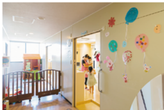
事業所内保育施設 いずみ