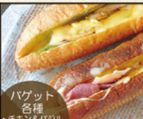
バゲット 各種 ・チキン&パサリ ・ハム&チーズ